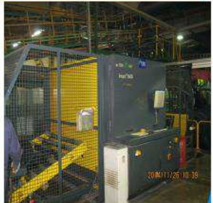
Контроль внутренней структуры шины